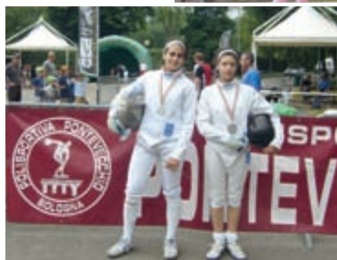
Nelle foto, due schermidori della Placci Scherma di Faenza durante un'esibizione dimostrativa svolta ai Giardini Margherita di Bologna, in occasione della Giornata Nazionale dello Sport 2011 organizzata dal CONI, Comitato Provinciale di Bologna.