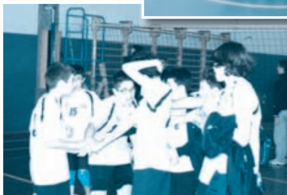
L'Under 14 in una fase di timeout.