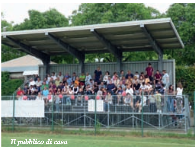
Il pubblico di casa

di due nuove scuole calcio, una istituita presso l'impianto sportivo del Pilastro, gestito anch'esso dalla Pontevecchio Calcio, l'altra, invece, è stata aperta al Centro Sportivo Arcoveggio, gestito in sinergia con l'ATC ACACIS Circolo Doz-