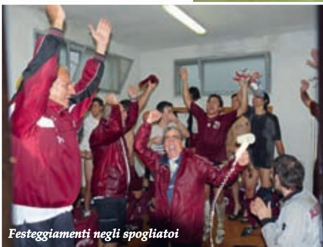
Festeggiamenti negli spogliatoi