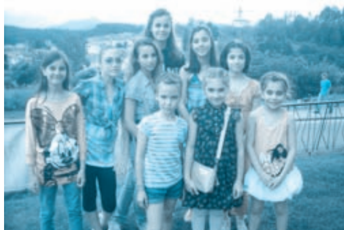
Nelle foto, il gruppo di atleti che ha partecipato al Camp estivo che si è tenuto a Baselghe di Pinè.

I corsi avranno inizio il 12 settembre e si rivolgono a tutti i livelli dai 3 ai 99 anni; sono suddivisi proprio secondo l'età e il livello e si svolgeranno il lunedì (17.30 - 20.30), il martedì e giovedì (17 - 21). La nuova stagione prenderà ufficialmente il via con una Festa presso il Palaghiaccio di Rastignano. Anticipazione sulle attività e sugli eventi in programma sono visibili sui siti ufficiali www.pontevecchiobologna.it e www.iceclubpontevecchio.it . Un'opportunità per tutti: Possibilità di svolgere anche feste private presso il Palaghiaccio di Rastignano, con entrata in pista ed eventuali lezioni private, singole e di gruppo.