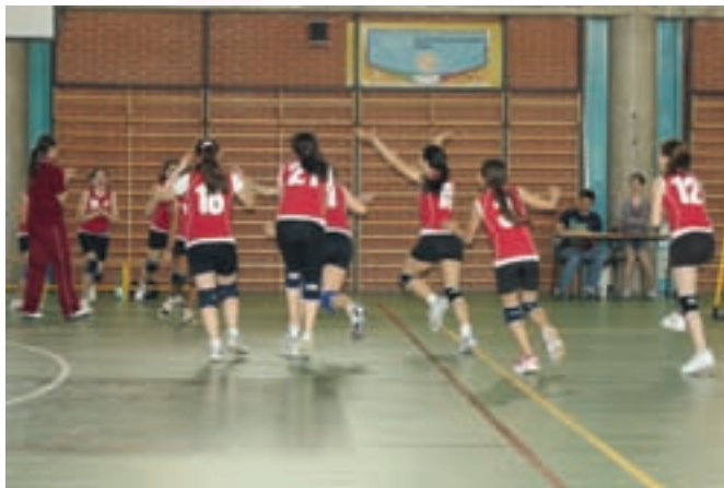
Nella foto l'Under 12 esulta dopo la vittoria contro il VIP.

Che il nostro settore giovanile sia stato trascinato dalle belle prestazioni della serie D, è la logica conseguenza di una normale forma “di appartenenza” che genera campanilismo, ma è altrettanto vero che le atlete della prima squadra hanno ricambiato con passione il percorso delle “giovani colleghe” per via di quei risultati che hanno oggettivamente sorpreso tutto l'ambiente del volley bolognese. Gli ottimi risultati ottenuti dai team under hanno portato la Pontevecchio ai vertici della pallavolo provinciale. Prima fra tutte la neo campionessa provinciale Under 16. Le ragazze