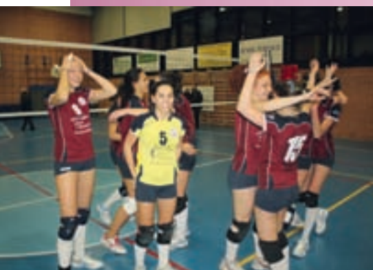
L'Under 16 esulta al fischio finale: è vittoria del campionato.